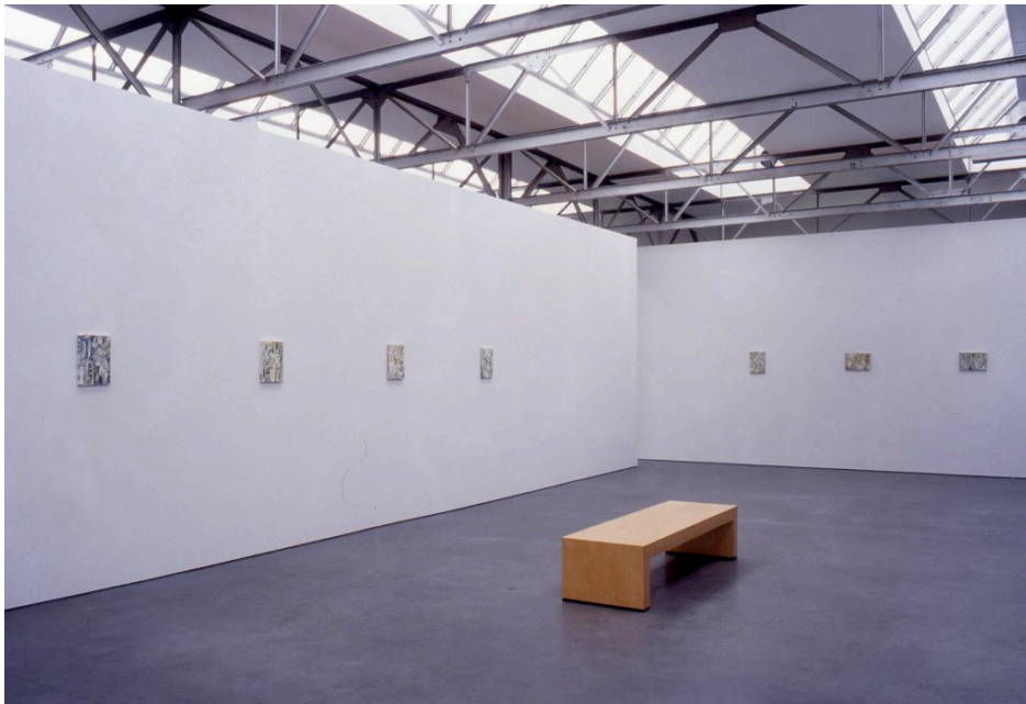
Zaaloverzicht Museum De Pont, Tilburg

Van Haaster ploegt, smeert en trekt sporen in de verflagen. Door de noeste schildersarbeid vermengen het geel, zwart en wit tot een haast monochroom vlak, waarin de patronen van wegen en constructies als echo's van de werkelijkheid zijn opgenomen. De landschappen hebben het aardse karakter van omwoeld polderland, maar kunnen evengoed het toneel van mythische sagen en legenden zijn.