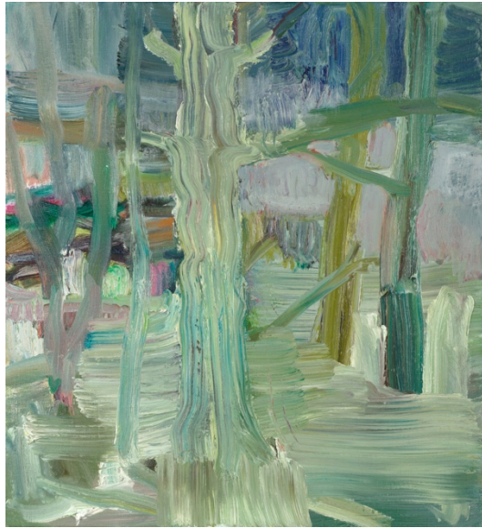
Snow, 53 x 48 cm oil on linen 2016

Zelf zegt ze het zo: "Het omzetten van de gegevens die ik verzamel door veel over het onderwerp te lezen, pas ik meestal niet letterlijk toe in mijn werk. Het is een subtiel proces waarbij alle informatie voor onbepaalde tijd in mij ligt te sluimeren. Vervolgens begin ik te werken en doe ik onderzoek naar de raakpunten waarmee ik mij kan verbinden. Het onderwerp wordt als een kledingstuk uitgelegd en ontrafeld." Het achterliggende verhaal is voor Welten slechts een tool, een toegangspoort om de schilderkunst verder te onderzoeken. Hierdoor zijn haar werken zo figuratief en abstract tegelijk, of anders gezegd: zo abstract in hun figuratie.